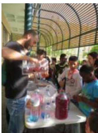
Taller botellas sensorial

El acto infantil los alumnos y profesores ellos aportan los material los juegos y monitores que son los alumnos/as es un acto de ellos creado y organizado por ellos/as con muy buena aceptación y diversión Se ha de valorar como un muy buen actos infantil