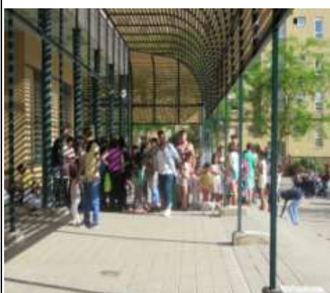
vistas de taller