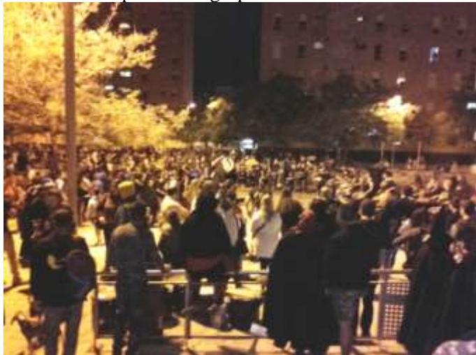
Batucada a la plaza con grupos invitados