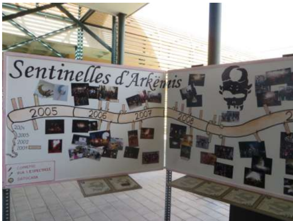
plafones de exposició del 10 aniversari dels Diablos