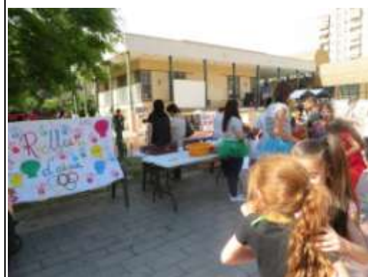
juegos en la plaza

Este año voluntario de Espronceda han participado en la fiesta del barrio, con un taller de botellas sensoriales por primera vez y dirigido a niños de 0 a 3 años.