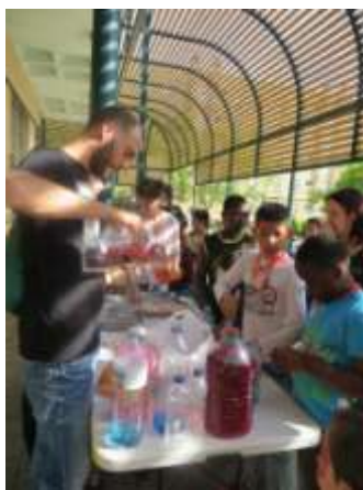
Taller botellas sensorial

El acto infantil los alumnos y profesores ellos aportan los material los juegos y monitores que son los alumnos/as es un acto de ellos creado y organizado por ellos/as con muy buena aceptación y diversión Se ha de valorar como un muy buen actos infantil