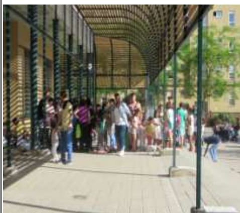
vistas de taller