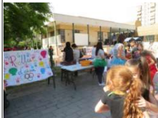
juegos en la plaza

Este año voluntario de Espronceda han participado en la fiesta del barrio, con un taller de botellas sensoriales por primera vez y dirigido a niños de 0 a 3 años.